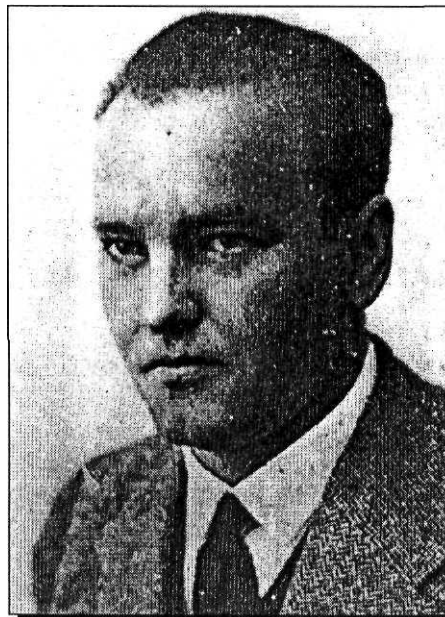
Josip Čižinsky Gorkić, sekretar KPJ

gradskoj je Skupštini izvršen atentat na hrvatske narodne zastupnike. Čim se u Zagrebu doznalo za zločin, hrvatska je mladež spontano počela demonstrirati protiv Beograda. Bratoljub Klaić će kasnije zabilježiti kako je javnost očekivala da vodstvo zatrubi na ustanak. Raspad Jugoslavije bio je na pragu. Na čelo demonstranata stali su pobornici ideje uspostave neovisne Hrvatske, a letcima su na demonstracije pozivali i komunisti. Zagrebački je Mjesni komitet KPJ pozvao na uspostavu neovisne hrvatske seljačke re-