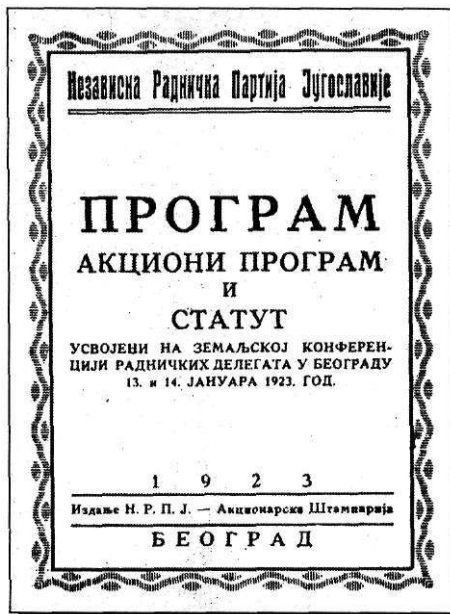
Dokumenti novoosnovane NRPJ (1923.)

Intelektualno vodstvo komunista iz Hrvatske ocjenjivalo je da u Hrvatskoj, uglavnom kao reakcija na srpsku mitologiju koja je stekla zaštitu i nove države, jačaju "nacionalni mitovi", kojima se buržoazija služi za zavaravanje naroda i za skretanje pozornosti s pravih problema, a pravi problem jest klasna borba i revolucija. Nacionalni mitovi, po njihovu sudu, jačaju reakcionarnu, građansku nacionalnu svi-