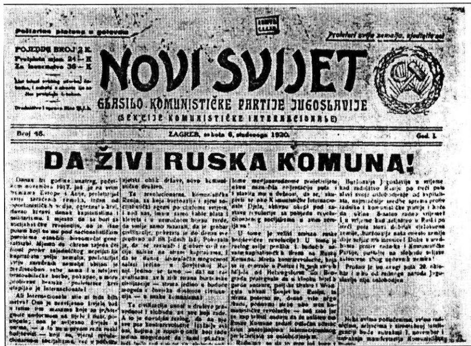
KPJ se u zaglavlju svojih glasila javno nazivala "sekcijom Komunističke internacionale"

Na temelju rasprave o nacionalnom pitanju, koju je na Lenjinov poticaj objavio 1913., 2 Josif V. Staljin smatranje stručnjakom za to područje, pa je u prvoj Lenjinovoj vladi nakon revolucije imenovan ministrom (komesarom) za nacionalna pitanja. Upravo kao i kod Lenjina, njegovo načelno priznavanje prava narodnog sa-